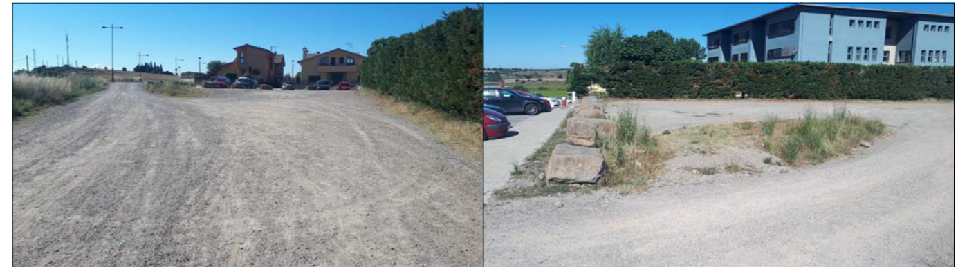
10. Enquitranament del camí de la segona entrada de l'Escola Luçanès.