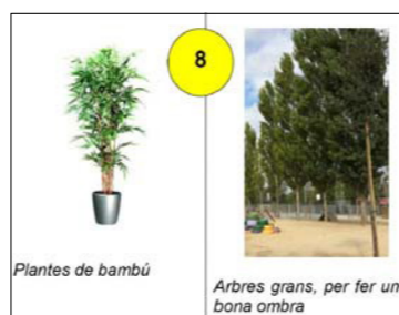
Plantes de bambú