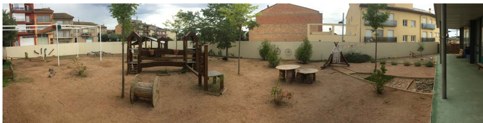
1. Espai de joc i aprenentatge a l'Escola Bressol La Pitota.