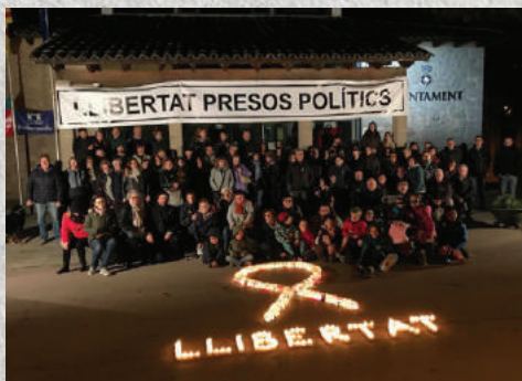
Fotografia de Jordi Pey